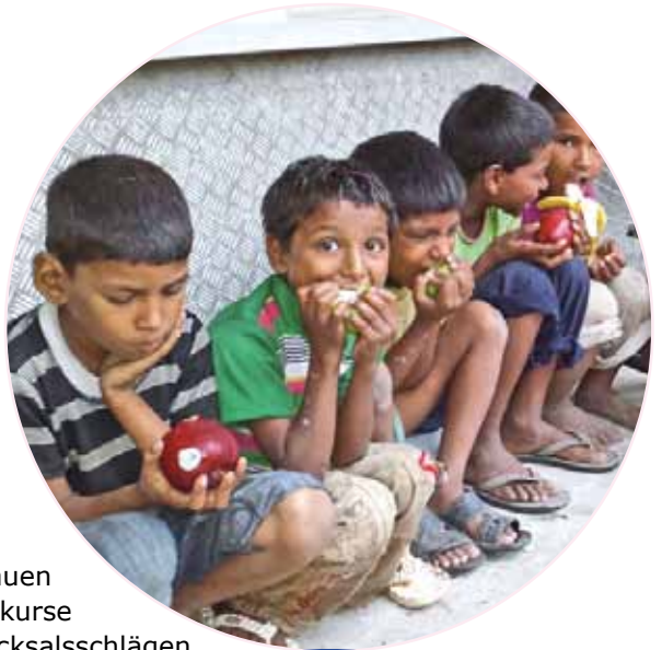
Diese Kinder essen zum ersten Mal in ihrem Leben frisches Obst